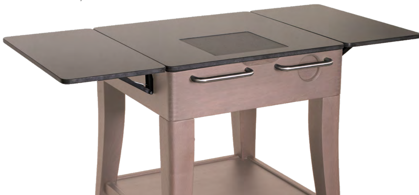
Simulation KM32 teinte 10 Oxyde Simulation KM32 shade 10 Oxyde

Simulation des teintes sur Photoshop Shades simulated on Photoshop