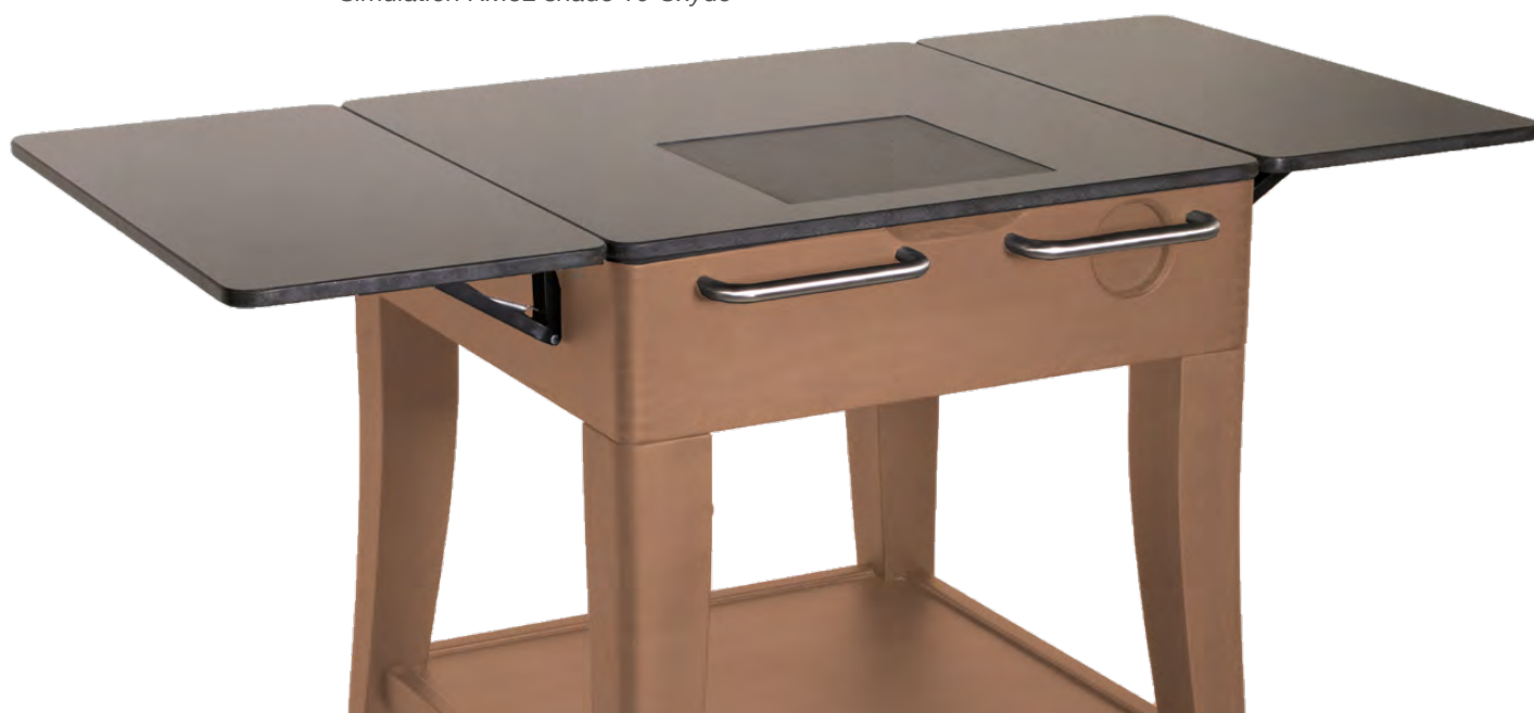
Simulation KM32 teinte 04 Humus Simulation KM32 shade 04 Humus

Simulation des teintes sur Photoshop Shades simulated on Photoshop