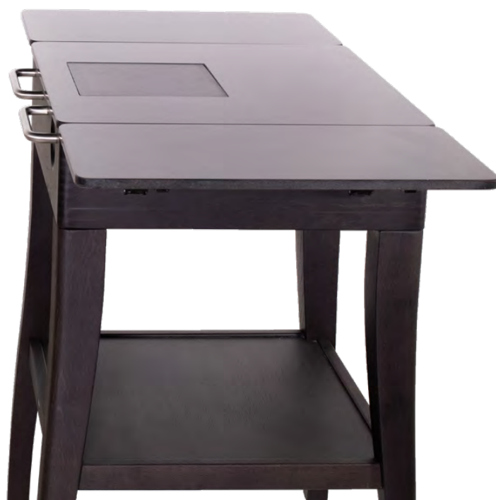
Chêne teinté noir et plateau en Quartz® blanc Black stained oak and white Quartz® top